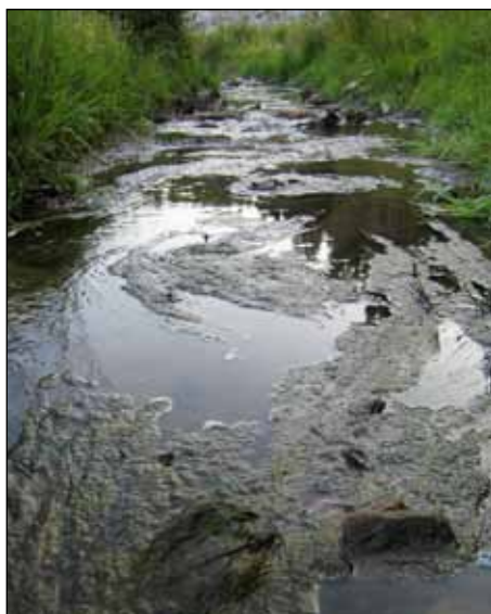
Assurbekken rett nord for Tusse. Bilde er tatt ved anleggsområdet for E6- tunnelen

Utbygging, deponier, veier og anleggsvirksomhet i nedbørfeltet til Tussetjernet medfører dramatisk økning i nitrogeninnhold og annen forurensning. Dette er problemer som Oppegård Vel har tatt opp med ansvarlige myndigheter over flere år, og situasjonen er nå så alvorlig at Ski kommune har bedt Fylkesmannen om å behandle det som en forurensningssak. Ski kommune har den 13. november 2012 anmeldt utbygging av Fugleåsen industriområde (Q4) for mulig brudd på forurensningsloven. Kopi av anmeldelsen finnes på www.oppegardvel.no