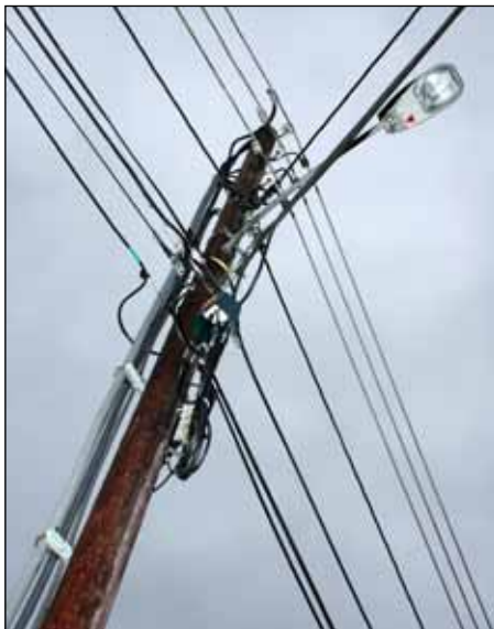
Eksempel på kabelspagetti i Sætreskogen

I store deler av Oppegård syd er lufthengte ledninger dominerende for distribusjon av strøm, telefon, kabel-TV og internett-signaler. Dette utgjør et estetisk problem, de henger ulovlig, og mange steder henger de for lavt. Ulike nettselskaper har leid plass i Hafslunds stolper, og de tynges ned av belastning fra ekstra kabler som har dukket