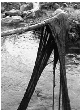
Algeoppblomstring i Assurbekken.

Om vi løfter blikket til hele Gjersjøens nedslagsfelt er tilstanden ikke oppløftende. Alle tilførslene har dårlig eller meget dårlig økologisk tilstand. NIVAs rapport for 2008 viser en alarmerende økning i utslippene av næringsstoffer og bakterier for årene