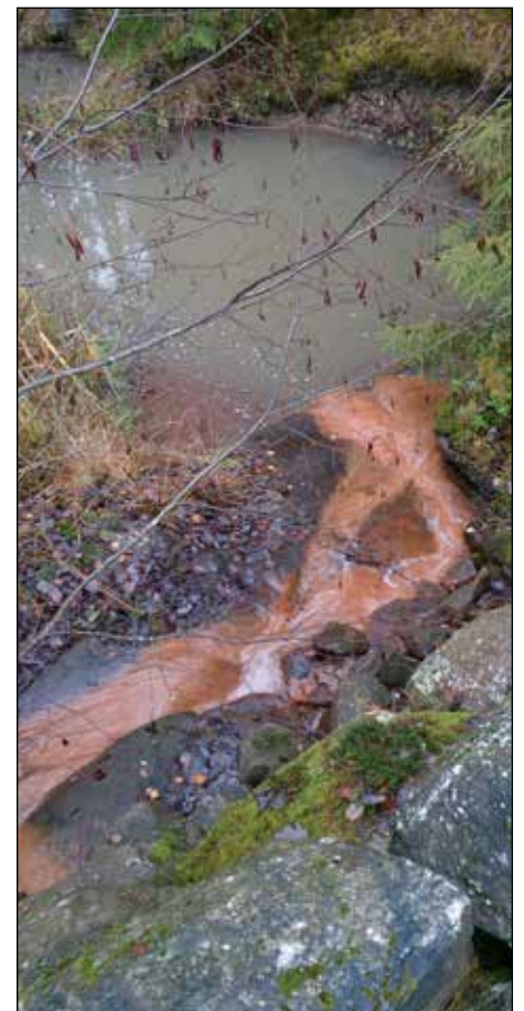
Bilde 1: Viser avrenning fra fylling ved Taraldrud

følger opp nye utbygginger med krav om tilfredsstillende rensetiltak. I løpet av år 2050 vil Follokommunene få 100.000 nye innbyggere, noe som krever stor oppfølging fra kommunene. I den siste tiden har vi erfart at presse og politikere nå har tatt opp forurensing som et problem, og at dette nå kommer offentligheten bedre til kjenne. Det er gledelig og nødvendig. Alle de nevnte kommuner har store utbyggingsplaner. Vi håper at investeringene også vil omfatte planer om målrettede tiltak mot forurensing. I et møte med PURA, som er kommunenes overvåkingspartner, kom det frem at det var stor uro omkring forurensingen av Gjersjøvassdraget. Avsetning av midler i kommunebudsjettene er små og bør økes betraktelig. Da regjeringen krever stor utbygging i de nevnte kommuner, bør tilskudd til forebyggende tiltak økes vesentlig. Det er lett å bevilge store midler til utenlandsprosjekter. Kanskje det nå er tid for å rydde opp i egen "bakgård".