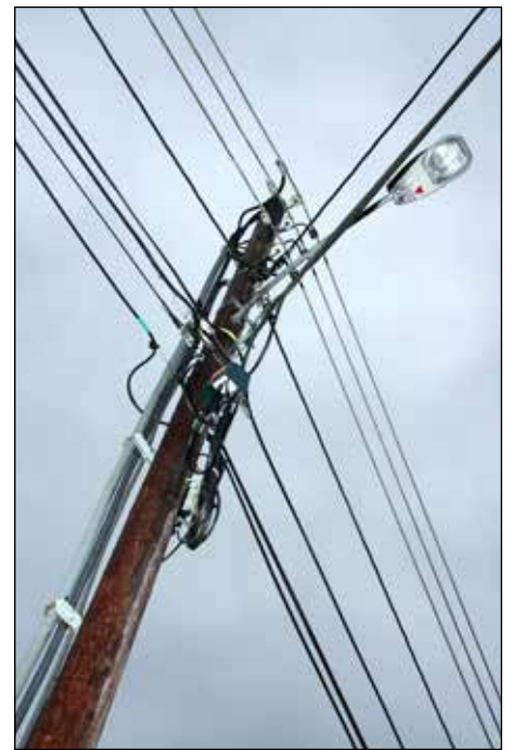
Bilde 2: Eksempel på kabelspagetti i Sætreskogen